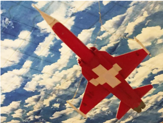
Ein hübsches Detail: Ein im Museum aufgehängter künstlicher Himmel mit einem Flugzeug.

Am 6. Oktober 2019 eröffneten wir die Ausstellung ‘Himmel über Wallisellen’ . Sie zeigt alle Aspekte des Himmels über Wallisellen, also zum Beispiel die Anfänge der Luftfahrt mit den Oldtimerflug-