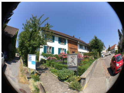
Das Ortsmuseum, mal aus der Froschperspektive aufgenommen.