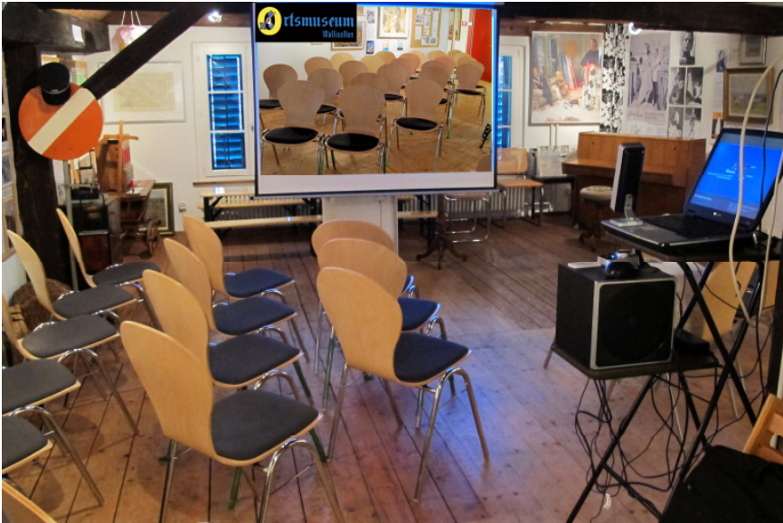
Die neue Bestuhlung samt erneuerter Technik im Vortragsraum.