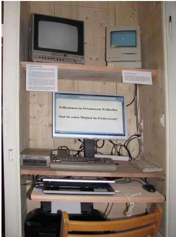
Die neue Computerkoje

Im Laufe des Jahres konnte das digitale Bildarchiv, das wir zusammen mit der Gemeinde erarbeiteten, in Betrieb genommen werden. Auf einer Harddisk sind nun über 6'000 historische Fotos abrufbar. Im Endausbau werden wir aber direkt auf den Server der Gemeinde Zugriff haben. Zu diesem Zweck bauten wir in einen unbenützten alten Treppenaufgang eine Koje ein, in welcher nun ein Computer samt Bildschirm, wie auch eine kleine Ausstellung von alten Computern Platz finden. Die neuen Geräte wurden uns freundlicherweise von der Gemeinde aus ihrem Fundus geschenkt.