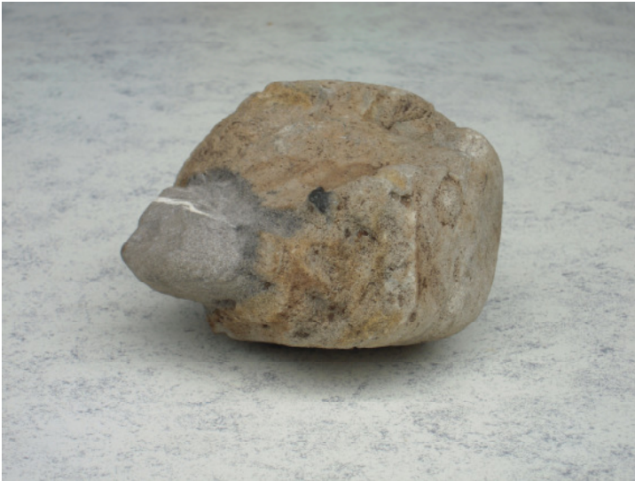
Der evt. 8'000 Jahre alte Schleu- derstein aus der Steinzeit.