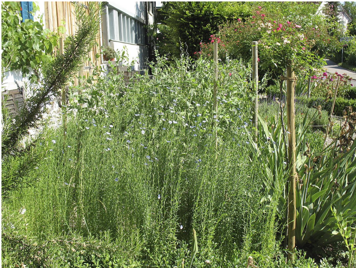
Blühender Flachs im Bau- erngar- ten des Orts- muse- ums.

Um die frühere Stoffgewinnung zeigen zu können, pflanzten wir in unserem Ortsmuseumsgarten extra Flachs an, ernteten ihn und konnten dann zeigen, wie gehechelt, gerätscht, gesponnen und gewoben wird.