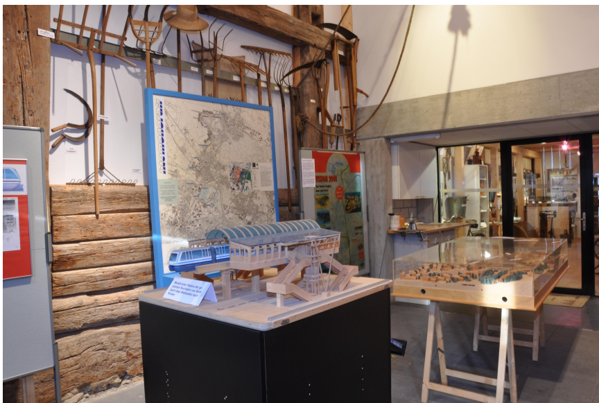
Modelle der 2001 geplanten Hochbahn von Stettbach über Wallisellen nach Kloten, die aber nie verwirklicht wurde.