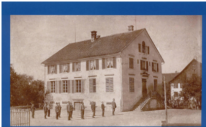
175 Jahre Volksschule Wallisellen 1832 - 2007

mit der Schule Wallisellen herausgegeben und in einer Auflage von 300 Exemplaren gedruckt wurde, wird im Museumsshop für 20 Franken verkauft.