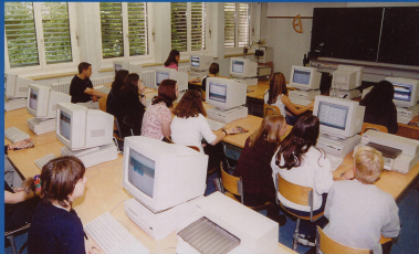
Eine Publikation des Ortsmuseums Wallisellen und der Schule Wallisellen, 2007

Den Autoren der „ Walliseller Chronik 2006 “ konnte der Museumsleiter wieder mit Rat und Tat helfen und vor allem reichhaltiges Bildmaterial aus dem Museum beisteuern.