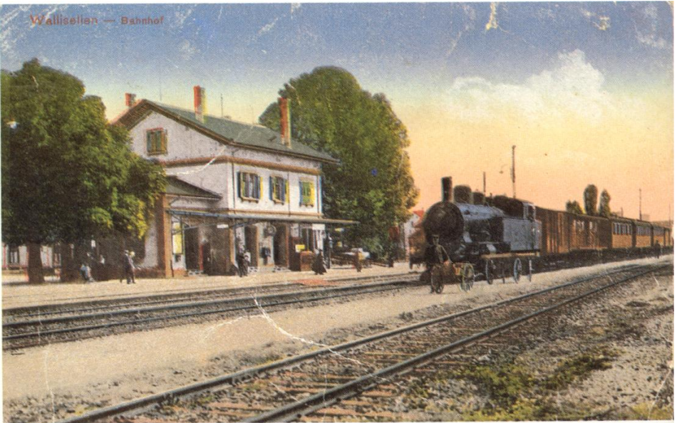
Der Bahnhof Wallisellen zur Zeit, als der Arlberg-Express Zürich – Wien noch durchfuhr, kolorierte Foto, ca. 1910