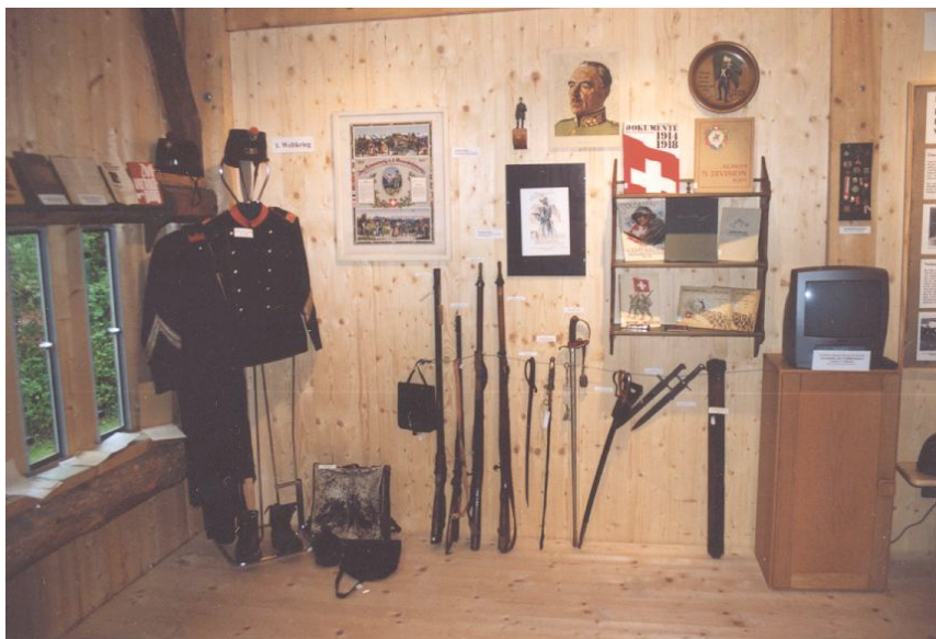
Die Wechselausstellung „Schwere Zeiten“ auf dem Heuboden.

Schon vor diesem Einweihungsakt, erst recht nachher, war das Museum jeden 1. Sonntag im Monat für die Öffentlichkeit geöffnet . Die Öffnungszeiten wurden ab April 2003 um eine Stunde auf 13.30 bis 16.30 Uhr verlängert. Im Laufe des Jahres machten in der Folge im Durchschnitt 24 Personen von diesem Angebot Gebrauch. Eine Zahl, mit der wir gut leben können, ist es doch kein Vergnügen, wenn sich allzu viele Personen zur gleichen Zeit im Haus aufhalten. Die Zahl der Aufsichtspersonen wurde auf drei erhöht, musste doch vermehrt Auskunft gegeben und geführt werden. Dabei liessen sich eine grosse Anzahl von Beziehungen knüpfen, ein Umstand, der sicher auch zur Hebung der Dorfgemeinschaft beiträgt.