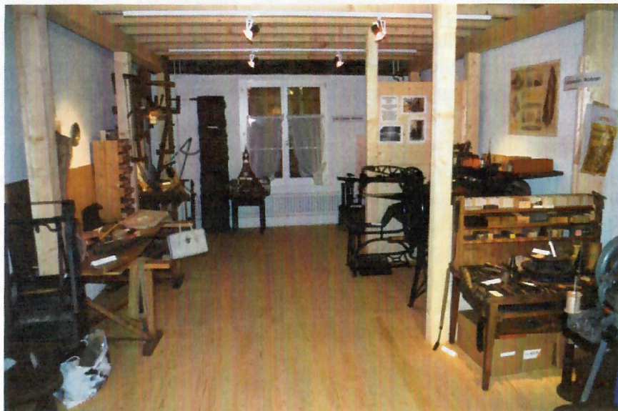
Blick in den Raum „Altes Handwerk“ mit Werkstätten von seltenen oder ausgestorbenen Handwerken.

Auch das Ortsmuseum hat die Aktivitäten des Fördervereins unterstützt: Anlässlich des Frühlingsmärts vom 11. Mai wurde ein Stand mit Gegenständen aus dem Museum ausgerüstet und bei der Werbung von neuen Mitgliedern wacker mitgeholfen.