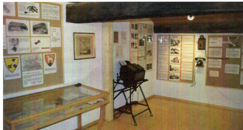
Schautafeln im Vortragsraum im obersten Stock mit Exponaten zur Gemeindegeschichte.

Das Hauptaugenmerk in dieser Zeit der Schaffung der ständigen Ausstellung war auf die Dauerhaftigkeit der Exponate, vor allem der Fotos und Pläne, gerichtet. Generell galt der Grundsatz, dass wegen Schädigung durch Lichteinflüsse möglichst keine Originalfotos und -pläne gezeigt werden. So wurden von allen Fotos per Computer Vergrösserungen erstellt, die zum besseren Schutz noch laminiert wurden. Nach langem Suchen konnten die grossen Pläne in einer auf diese Arbeit spezialisierten Firma in Rapperswil relativ günstig kopiert werden, so dass keine Originale aufgehängt werden müssen.