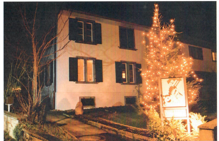
Das Ortsmuseum mit dem zu Weihnachten 2002 vom Verkehrs- und Verschönerungsverein Wallisellen im Garten aufgestellten Weihnachtsbaum