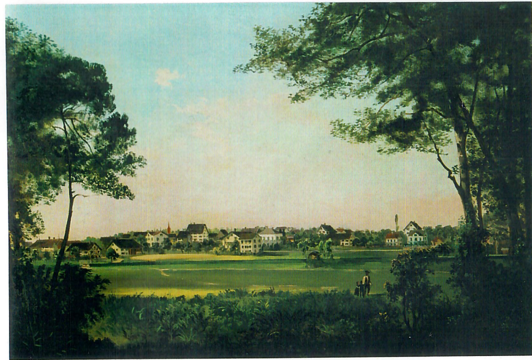
Wallisellen von Süden Ölgemälde von Julius Rieter, ca. 1870